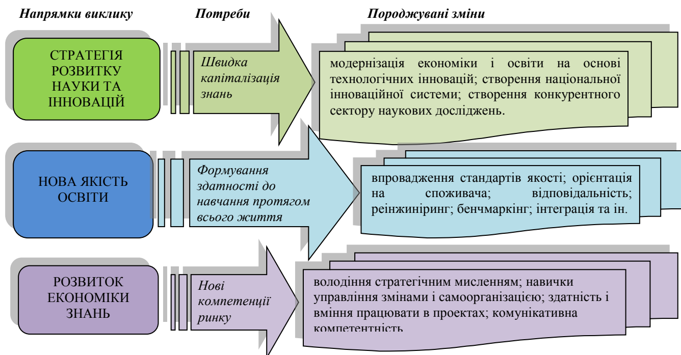
Рис 2. Виклики інноваційного середовища

Процеси організації пов'язані з розробкою процедур у сфері взаємодії ринків освітніх послуг і праці. Особлива увага тут повинна приділятися проектування моделей взаємодії, заснованих на аналізі соціально-економічної ситуації, прогнозування тенденцій розвитку ринків, а також викликам інноваційного середовища (рис 2.).