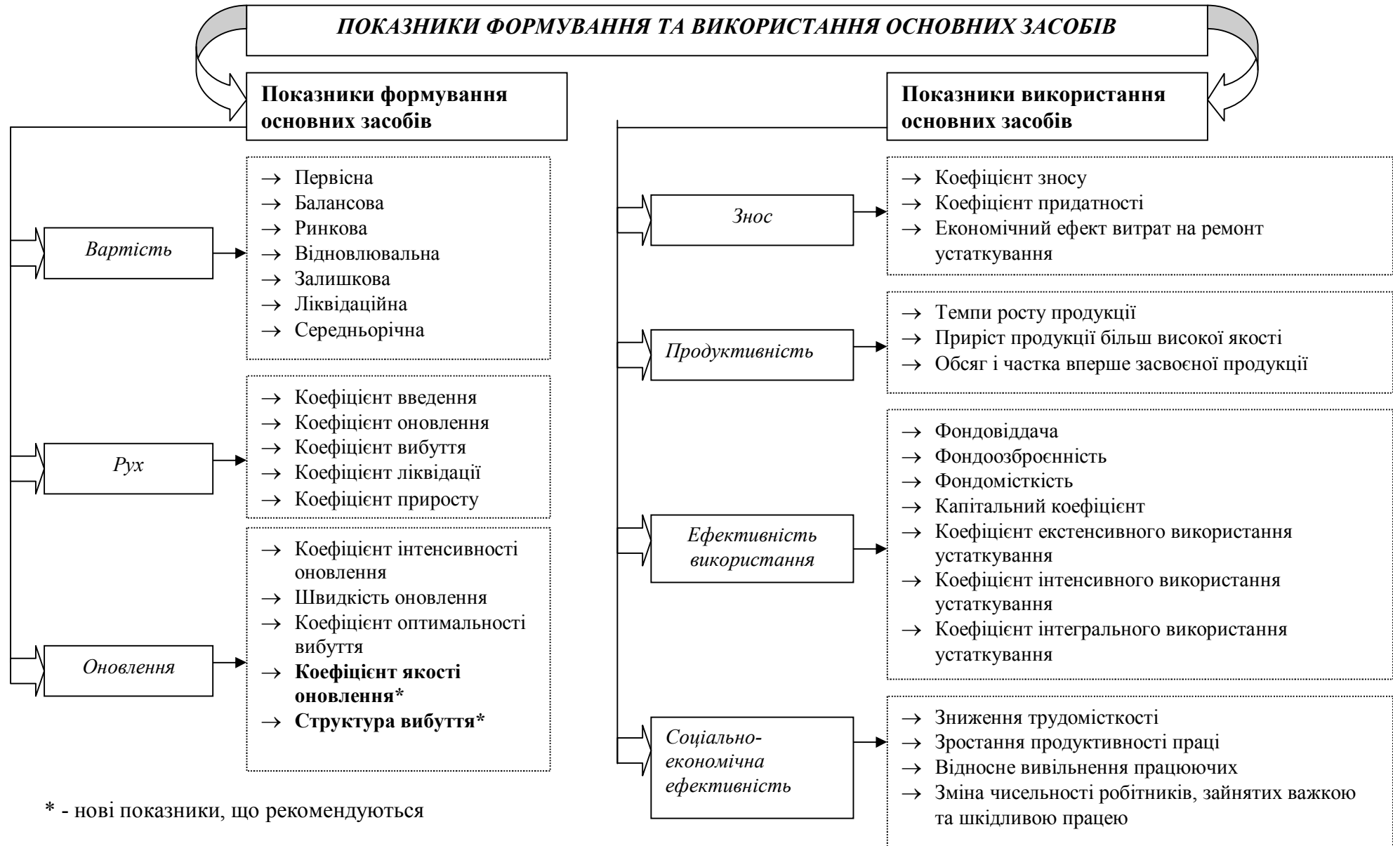
Рис. 1. Система показників формування та використання основних засобів