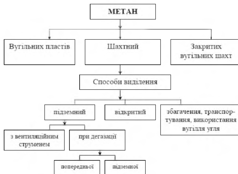
Рисунок 2 – Джерела викидів метану у вугільній галузі

На даний час важко знайти джерело інформації в якому б у консолідованому вигляді була надана підтверджена інформація про запаси шахтного метану та викиди його в атмосферу. Наприклад, за даними Міністерства енергетики та вугільної промисловості України, українськими шахтами щорічно в атмосферу викидається близько 1 млрд. м 3 метану. Системами шахтної дегазації в останні роки каптовано близько 13% метану від загального обсягу. Крім того, лише на 10 з 28 шахт метан утилізований для власних потреб у якості пального для генерації тепла у котлах [5]. Щорічні викиди метану в атмосферу на шахтах з навантаженням 1 млн. т вугілля в рік досягають 20-50 млн. м 3 [8]. Структура джерел викиду метану у вугільній галузі представлена на рис. 2 [4].