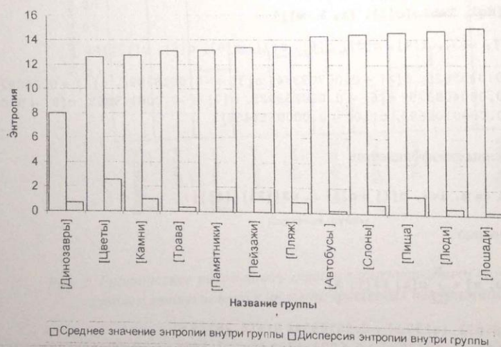
Рис. 1. Матожидание и дисперсия энтропии семантических групп

Проанализируем используемый тестовый набор с точки зрения рассмотренного критерия. На рис. 1 приведены средние показатели и дисперсии энтропии для каждой из анализируем групп.