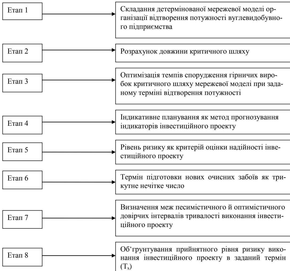
Рисунок 1. – Етапи механізму оцінки інвестиційного проекту

Етап 2. Розрахунок довжини критичного шляху мережевої моделі. Для кожної гірничої виробки мережевої моделі встановлюються: