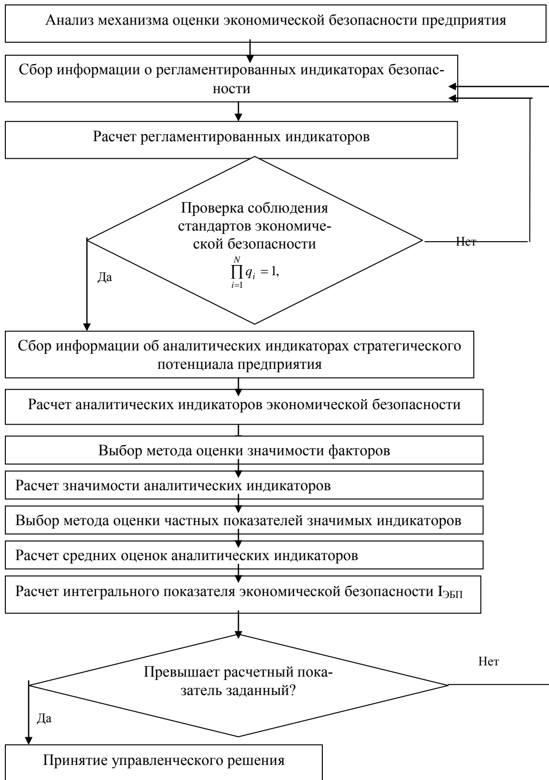
Рисунок 3. – Алгоритм оценки экономической безопасности предприятия