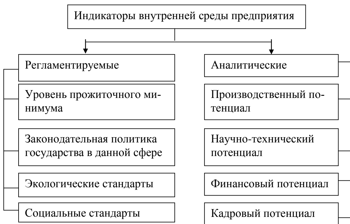
Рис. 2. Индикаторы экономической безопасности предприятия

ности. К таким стандартам могут быть отнесены: уровень оплаты труда работающих, пороговым значением которого должен быть размер не ниже прожиточного минимума, установленного государством; себестоимость продукции, пороговые значения ко торой являются общественно-необходимые затраты, определяемые методикой, используемой в системе бенчмаркетинга; норма прибыли, нижнее значение которой должно обеспечить уплаты регламентированных налоговой службой платежных обязательств; наличие доли рынка (спроса) на поставку продукции в объеме не ниже критического (точки безубыточности); нормы экономических стандартов и другие.