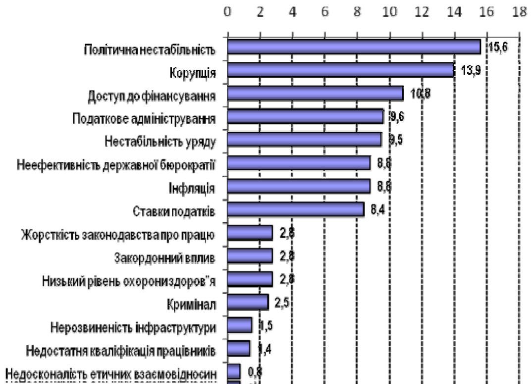
Рис. 3. Основні фактори, що перешкоджають веденню бізнесу в Україні у 2010 р.

Найбільш проблематичними факторами ведення бізнесу в 2010 р. в Україні, за оцінками фахівців Всесвітнього Економічного Форуму [7, С.314], були: політична нестабільність, труднощі з фінансуванням, корупція, податкове адміністрування тощо (див. Рис. 3).