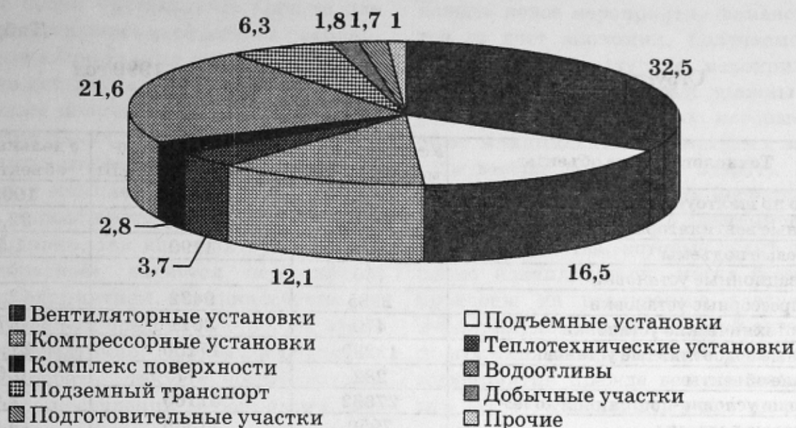
Рис. 2. Баланс потребления электроэнергии (%) по шахтоуправлению за 1999 год

Анализ данных, приведенных в таблице 1 и на рисунке 2 показал, что наиболее энергоемкими потребителями являются стационарные установки, на потребление электроэнергии которых объём добычи угля не оказывает решающего влияния. Так, главные вентиляторные установки потребляют 32,5% общего расхода электроэнергии предприятием за год, компрессорные установки потребляют 12,1%, главные водоотливные установки потребляют 21,6%. В сумме по самым энергоемким потребителям электроэнергии, на которых объём добычи не оказывает влияния, расход электроэнергии составляет около 66,2%.