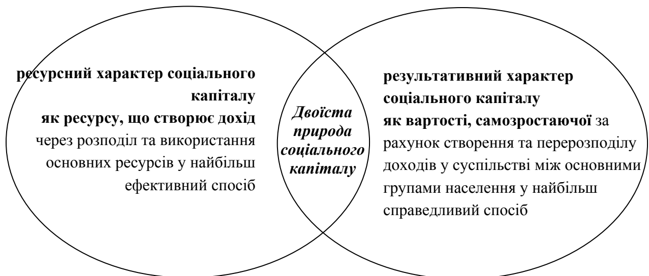
Рис. 1. Двоїста ресурсно-результативна природа соціального капіталу

Відомо, що будь-який капітал розглядається, з одного боку, як ресурс виробництва, а з іншого - виступає в якості такого результату цього процесу, що здатен самозростати. Виходячи з попереднього аналізу [2] соціального капіталу також можна представити двома відповідними сторонами: ресурсною та результативною. Згідно з першим підходом соціальний капітал є ресурсом зростання ефективності розподілу та використання інших ресурсів, фактором нагромадження матеріального результату процесу виробництва. З результативної точки зору, соціальний капітал бере безпосередню участь у перерозподілі доходів в економіці, чим формує і підвищує рівень суспільного добробуту. Тож, цей феномен має двоїтий характер, що можна схематично показати наступним чином (рис.1):