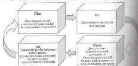
Рис. 3 Организация управления развитием предприятия на основе процессных инноваций (составлено автором)

Результативность деятельности предприятий в процессе их функционирования во многом определяется уровнем Эффективности управления, достичь которого возможно только при условии Реализации полного набора инновационных управленческих решений. Рассматривая предприятие как сложную многоуровневую социально-экономическую систему, в которой реализуются сеть бизнес-процессов, внедрение разработанного механизма позволяет представить как процесс реализации следующих функций управления: постановка целей и тактических задач совершенствования бизнес-процессов, планирование изменений, организация, обучение персонала, мотивация, контроль и регулирование действий, принятие и обеспечение выполнения управленческих решений по внутреннему процессу инновации (рис. 3).