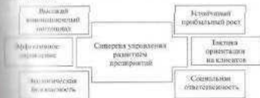
Рис. 2 Система ценностей современных предприятий (составлено автором)

Система комплексной управленческих ценностей определяет целевые ориентиры концепции управления развитием предприятий на основе процессных инноваций (рис. 2).