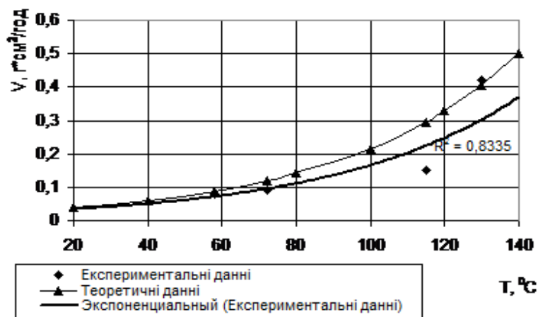
Рисунок 2 - Швидкість накипоутворення при добутку жорсткості на лужність 6,96 (мг·екв/кг) 2

В результаті розрахунків одержані 2 теоретичні криві, які з високою надійністю описують залежність інтенсивності накипоутворення від температури в значному діапазоні значень добутку лужності на жорсткість. При перевищенні вказаних значень Са·Л процес накипоутворення підкоряється іншим механізмам, які не враховуються у формулі (2). Слід зазначити, що на практиці вода з таким значенням Са·Л практично не використовується для підживлення теплових мереж.