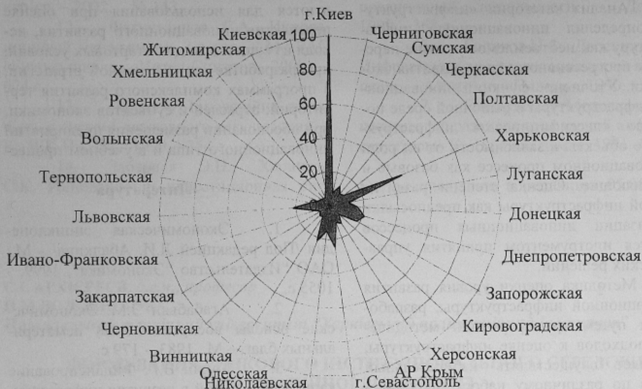
Рис. 2. Результативность инновационной инфраструктуры

гионе, возникает в других регионах страны.