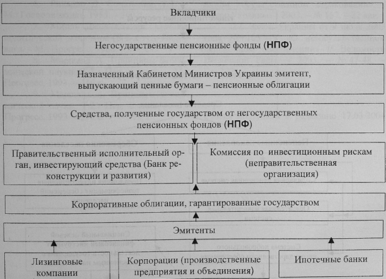
Рис. 2. Использование средств негосударственной накопительной пенсионной системы

сактивами, выпуская закладные облигации. Экономический смысл предоставления пенсионным фондам гарантий государства – исключение на будущее упущенной выгоды, вполне возможной в связи с неустойчивостью финансовой системы страны, проблемами Государственного бюджета, с высокой вероятностью потери ликвидности государственных ценных бумаг при чрезвычайных обстоятельствах. Поэтому необходимо предусмотреть в качестве гарантий заклад – пакеты акций (облигаций) предприятий, находящихся в государственной собственности. Это будет стимулировать НПФ к размещению своих пенсионных резервов в государственные пенсионные облигации.