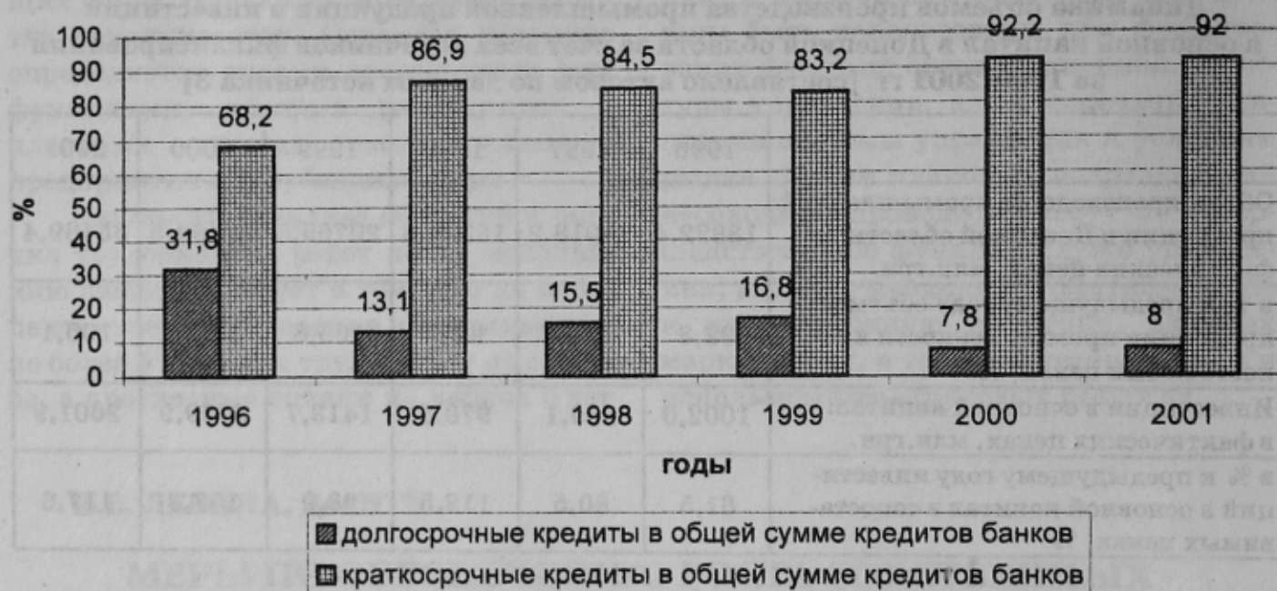
Рис. 1. Динамика размещения долгосрочных и краткосрочных кредитов банками Донецкой области [составлено автором по данным источника 3]

объеме кредитов, и в 2001 г. составил 92%. Очевидно, что произошла переориентация банковской системы с производственных инвестиций на финансовые операции, краткосрочные займы под высокий процент. Средневзвешенная процентная ставка по кредитам, выданным субъектам хозяйственной деятельности в 2000 г. составила 39,2% [3]. Для промышленных инвестиций такая ставка неприемлема и ограничивает инвестиционные возможности предприятия.