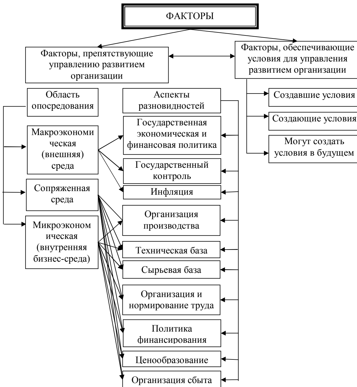
Рис. 3. Классификация факторов среды, влияющих на управление развитием