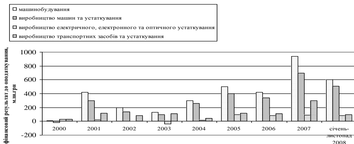
Рис.3. Фінансовий результат діяльності машинобудівних підприємств до оподаткування

Згідно з даним рисунком видно, що динаміка обсягів продукції має хвилеподібну тенденцію, причому починаючи з 2007 р. відбувається стрімке зменшення виробництва машинобудівної продукції, що пов'язано з кризою внутрішнього і зовнішнього ринків. Такі тенденції в результатах виробничої діяльності є головним фактором фінансових результатів, які характеризують ефективність виробничої діяльності (див. рис.2) [1,2].