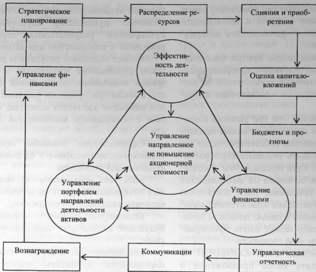
Рис. 1. Место управления, направленного на повышение акционерной стоимости в общем процессе управления

Основные показатели эффективности связывают акционерную стоимость с оперативными решениями, которые увеличивают эту стоимость (см. рис. 2).