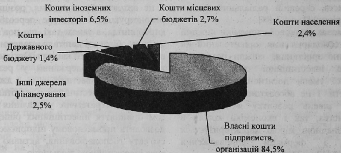
Рис. 1. Структура інвестицій в основний капітал у 2001 р.

тивізацію інвестиційної діяльності підприємств. Сьогодні частка іноземних інвестицій в обсязі інвестиційних ресурсів Запорізької області переважає. Якщо порівняти данні за 1999–2001 рр., то ми побачимо, що прямі іноземні інвестиції (надходження) у 2000 р. зросли у 4,1 рази у порівнянні з 1999 р., а у 2001 р. у 4,8 рази у порівнянні із 2000 р. Протягом 2001 р. в економіці області закордонними інвесторами вкладено $37,5 млн. прямих інвестицій, або в 4,8 рази більше, ніж за 2000 р. Загальний обсяг інвестицій за 2001 р. склав 1,2 млрд. грн. близько 85% цієї суми складають власні кошти господарюючих суб'єктів області, які спрямовані в основному на реконструкцію і технічне переозброєння виробництва з метою збільшення випуску конкурентоспроможної продукції [3, с. 12]. На рис. 1 показано структуру інвестицій в основний капітал Запорізького регіону у 2001 році.