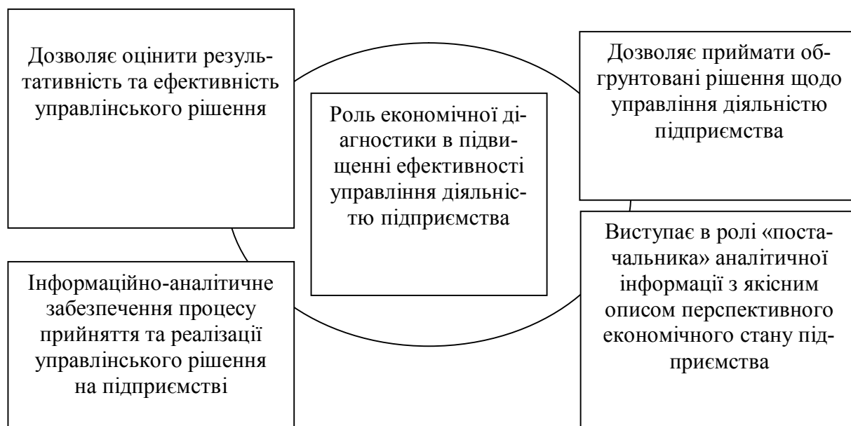
Рис. 3 Роль економічної діагностики в підвищенні ефективності управління діяльністю підприємства

Отже, використання діагностики для оцінювання ефективності діяльності підприємств особливо актуальне для перспектив діяльності кожного підприємства, тому що якісно проведена діагностика створює необхідне аналітичне підґрунтя для формування умов ефективного управління діяльністю підприємства, визначення переліку раціональних заходів щодо підвищення прибутковості.