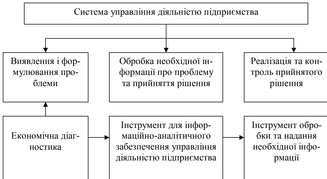
Рис. 2. Місце економічної діагностики в системі управління діяльністю підприємства

Також важливим є оцінка ролі економічної діагностики в підвищенні ефективності управління діяльністю підприємства, яку наведено на рис. 3. Роль економічної діагностики полягає в інформаційно-аналітичному забезпеченні процесу прийняття і реалізації управлінського рішення на підприємстві. Від того наскільки достовірна і повна інформація формується в процесі економічної діагностики, залежить якість прийнятого рішення, а надалі і підвищення ефективності діяльності підприємства [2, с. 11].