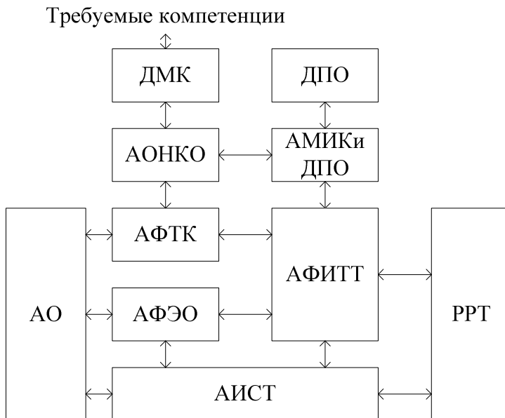
Рисунок 2 – Организация подсистемы оценки компетенций

индивидуальной среды тестирования (АИСТ). Динамическая модель компетенций (ДМК) создается на основе образовательно-квалификационной характеристики (ОКХ) для специальности и может меняться в процессе подготовки при корректировке учебных планов и появлении новых компетенций. Динамический профиль обучаемого хранит информацию об обучаемом. В нем фиксируются все полученные в ходе обучения и подтвержденные проверкой компетенции.