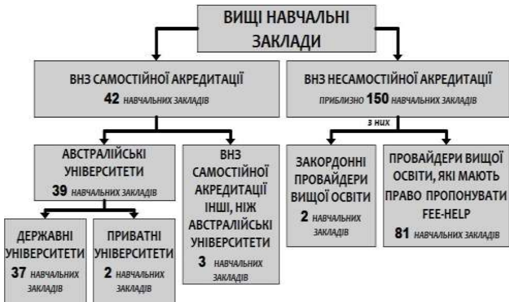
Рис. 1. Класифікація ВНЗ Австралії.