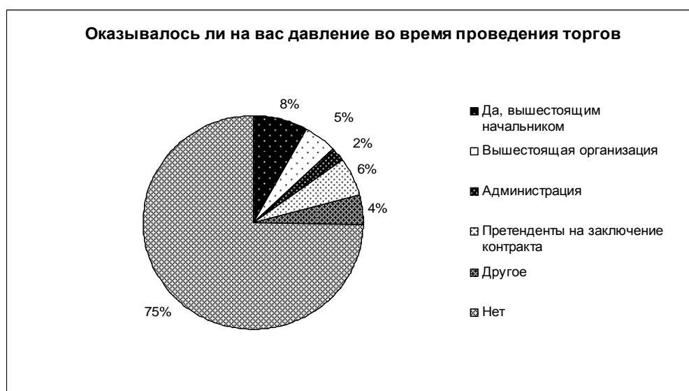
Рис. 3. Давление во время проведения торгов 18

Интересен тот факт, что на подавляющее большинство заказчиков никто не оказывал давление при проведении закупочных процедур (рисунок 3). Это показывает, что чаще оппортунистическое поведение является эндогенной поведенческой предпосылкой, возникающей под воздействием соответ-