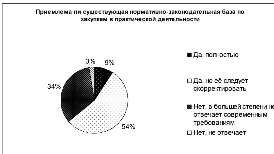
Рис. 4. Отношение к законодательству о закупках 19