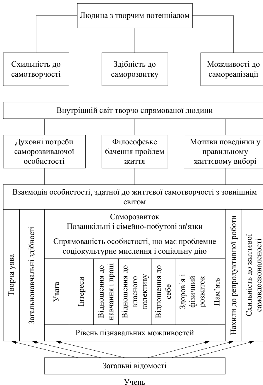
Рис.2 Формування творчого потенціалу учня

Важливим моментом є розподіл завдань по групах, обговорення можливих методів дослідження, пошуку інформації, творчих розв'язків. Потім починається самостійна робота учасників проекту по своїх індивідуальних або групових дослідницьких творчих завданнях. Постійно проводяться проміжні обговорення отриманих даних у групах (на уроках або на заняттях у науковому суспільстві, у груповій роботі в бібліотеці та ін.). Необхідним етапом виконання проектів є їхній захист, опонування. Завершується робота колективним обговоренням, експертизою, оголошенням результатів зовнішньої оцінки, формулюванням висновків.