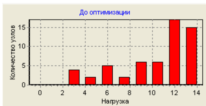
Рис. 1 – Гистограмма распределения трафика между узлами спроса

После формирования кластера, определяется узел спроса, как центр тяготения на основании выражений (3), (4). В результате работы алгоритма распределение трафика между узлами спроса может иметь вид, показанный на рис. 1.