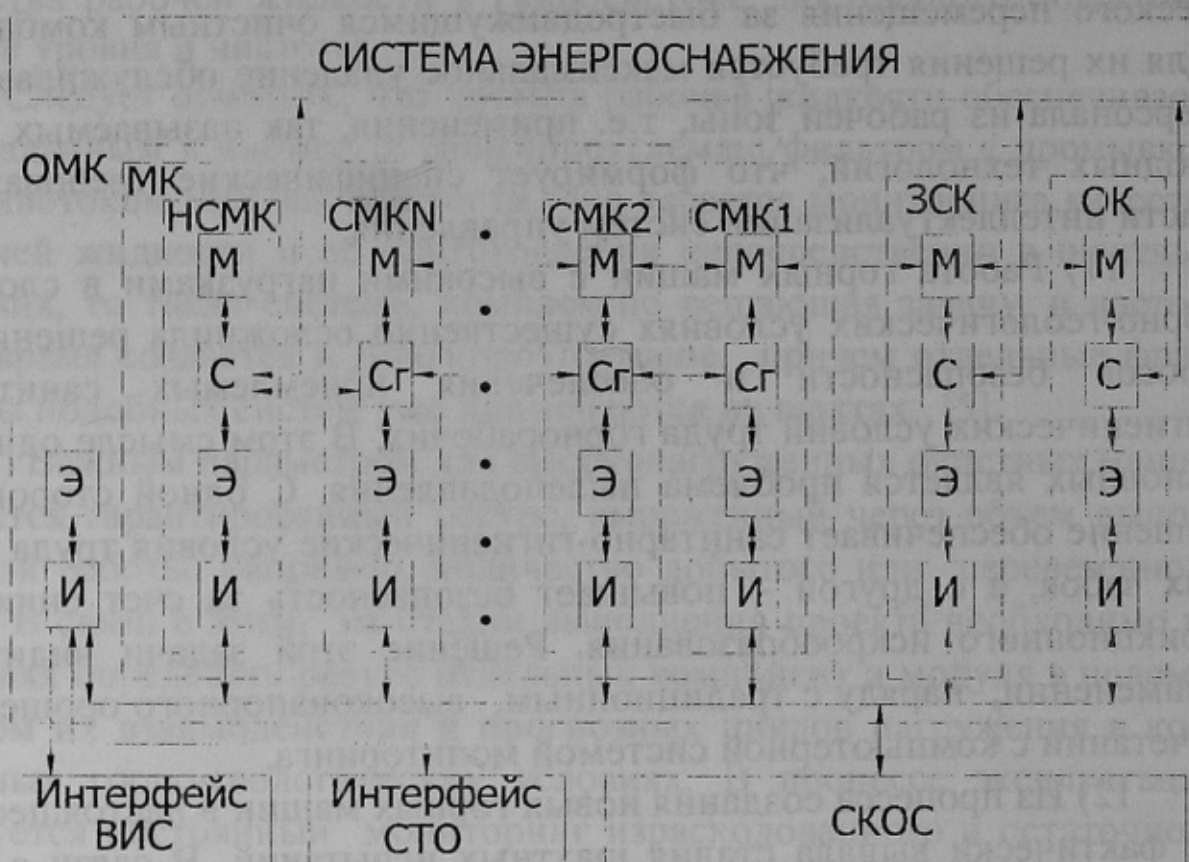
Рисунок 1 - Функционально-структурная схема ОМК как мехатронной системы.

На рис. 1 в соответствии с классификацией мехатронных объектов, предложенной в [1,2], приняты следующие обозначения: ОК – мехатронный агрегат «очистной комбайн», ЗСК – мехатронный агрегат «забойный скребковый конвейер», СМК1, СМК2, ... СМК N – мехатронные агрегаты «секция механизированной крепи», НСМК – мехатронный агрегат «насосная станции механизированной крепи» (их может быть несколько), М, С, Э, И – соответственно, механическая, силовая, электронная и информационная компоненты; С _Г – силовая гидравлическая компонента механизированной крепи; ВИС – внешняя информационная система; СТО – сопряженное технологическое оборудование; СКОС – система контроля окружающей среды.