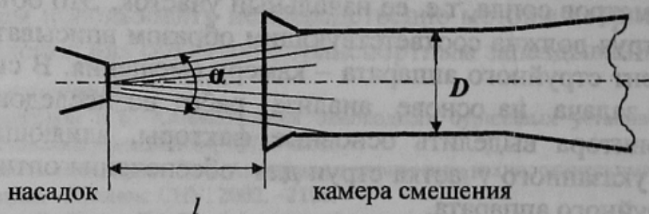
Рис.2. Водовоздушный эжектор

При этом различные исследователи получали значения одних и тех же параметров струи значительно отличающихся друг от друга. Так, тангенс угла расширения струи колебался от 0,008 до 0,052. Это не давало возможности даже приблизительно определить параметры водовоздушного эжектора.