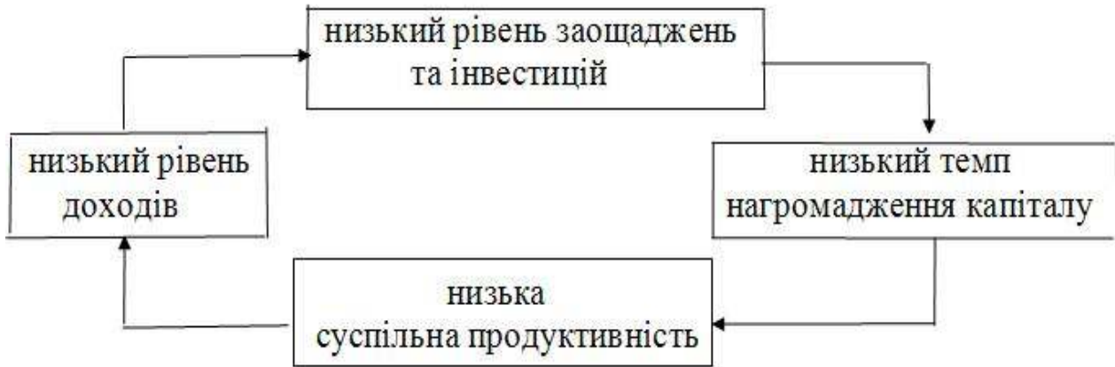
Рис. 1.7.1. Економіка України: порочне коло бідності.