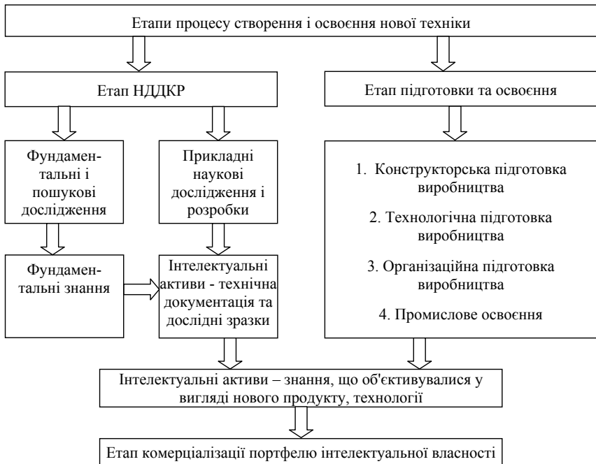
Рис. 3. Основні етапи створення та комерціалізації портфелю ІВ

Визначено, що портфель ІВ фірми формується на основі її інтелектуального капіталу. Істотна відмінність цього процесу від введення в господарський обіг інших видів капіталу (матеріальних ресурсів, фінансів тощо) полягає в тому, що ІК може бути реалізовано і оцінено лише в контексті діяльності фірми, а сам процес введення ІК в господарський обіг (комерціалізація), перетворення його в портфель ІВ як різновиду капіталу фірми є складним і багатоетапним процесом (рис.3).