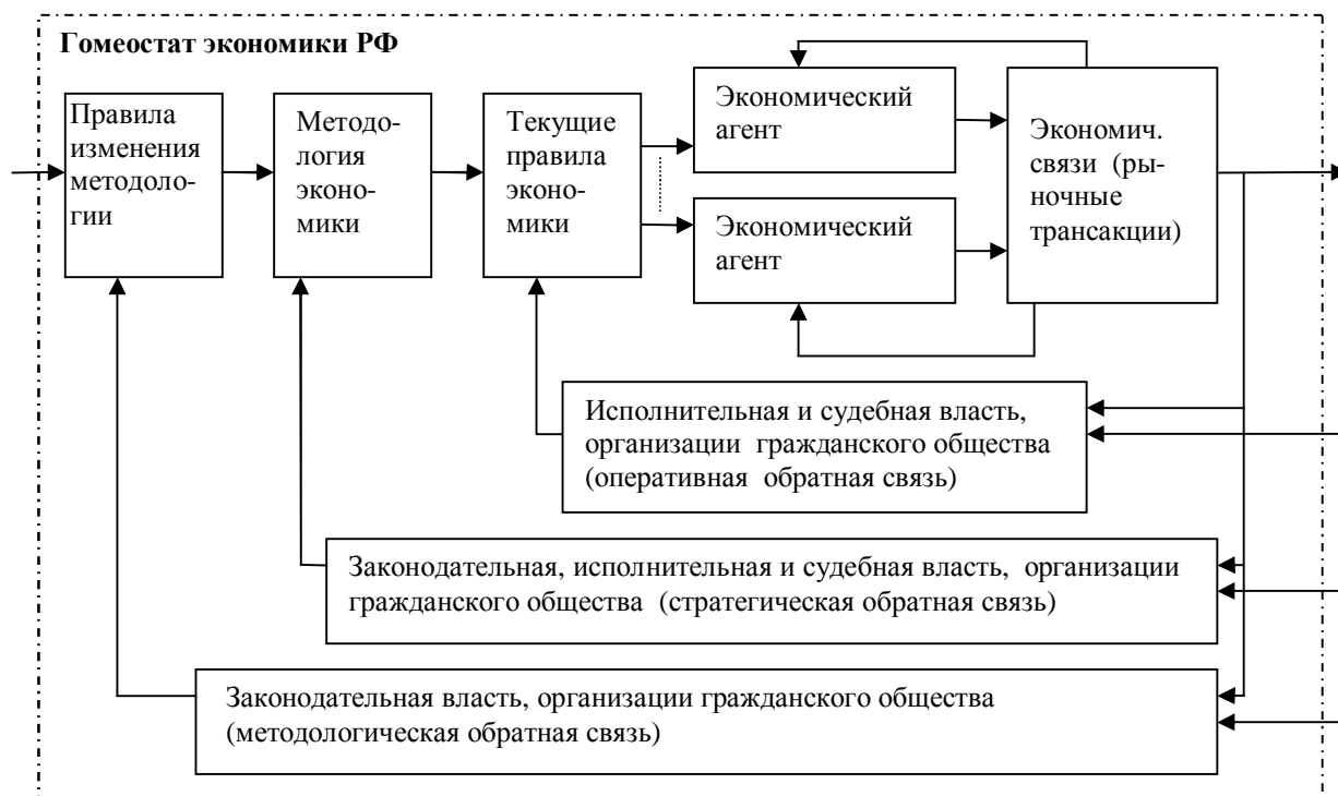
Рис. 2. Конфигуратор российской экономики как самоорганизующейся системы гомеостатического типа

К государственным органам этого уровня относятся исполнительные и судебные органы власти, которые должны контролировать выполнение текущих правил экономическими агентами и наказывать нарушителей.