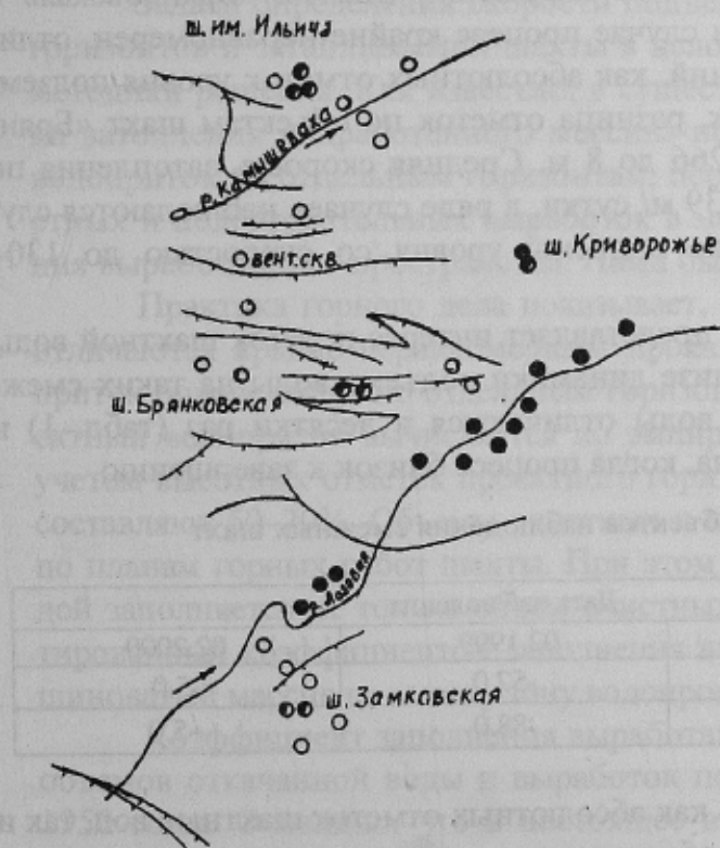
Рис. 1. Схема расположения объектов гидромониторинга

Объекты наблюдения по трем затапливаемым шахтам расположены крайне неравномерно (рис.1). Так, в поймах рек, с целью определения зоны возможного затопления и предупреждения отрицательных воздействий на природную среду, пробурены и наблюдались 16 гидронаблюдательных скважин. В центральных частях шахтных полей мониторинг прово-