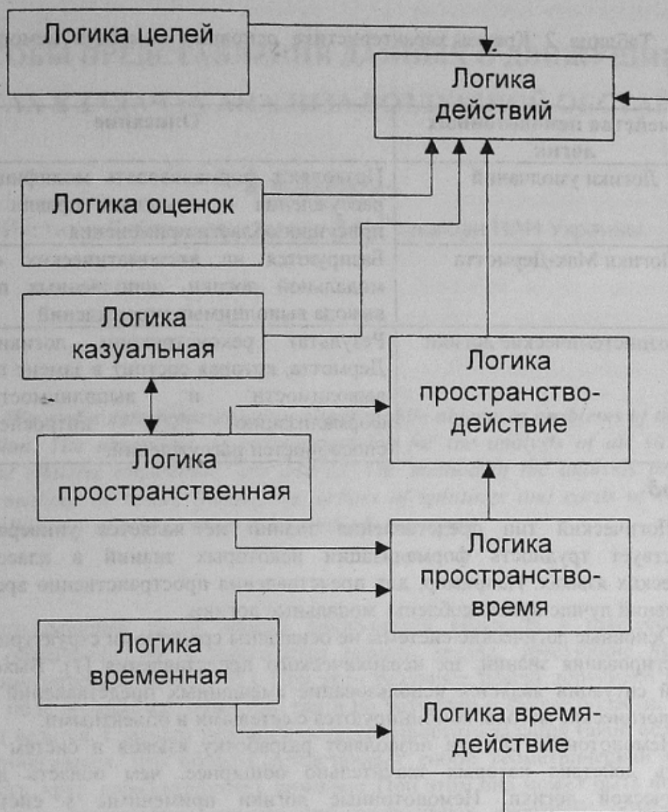
Рисунок 2-Система псевдофизических логик