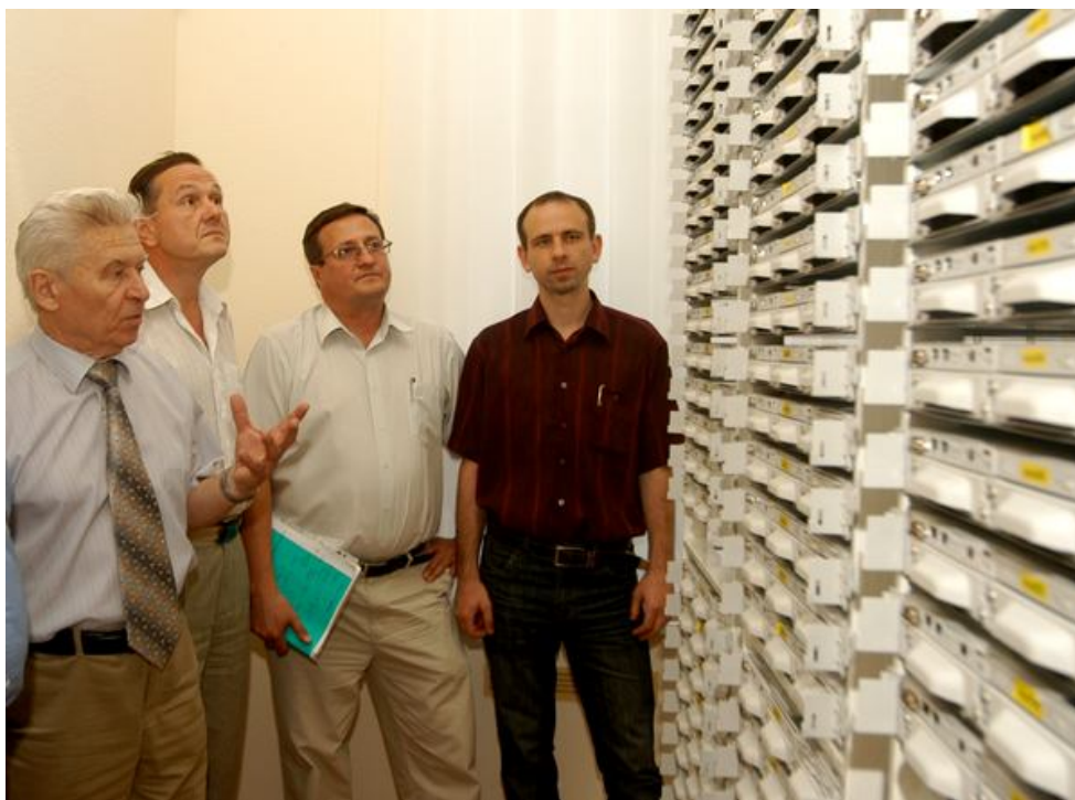
2012: Преподаватели кафедры КИ на фоне суперкомпьютера NEC Xeon Linux Cluster

(уникальное оборудование – «національне надбання»)