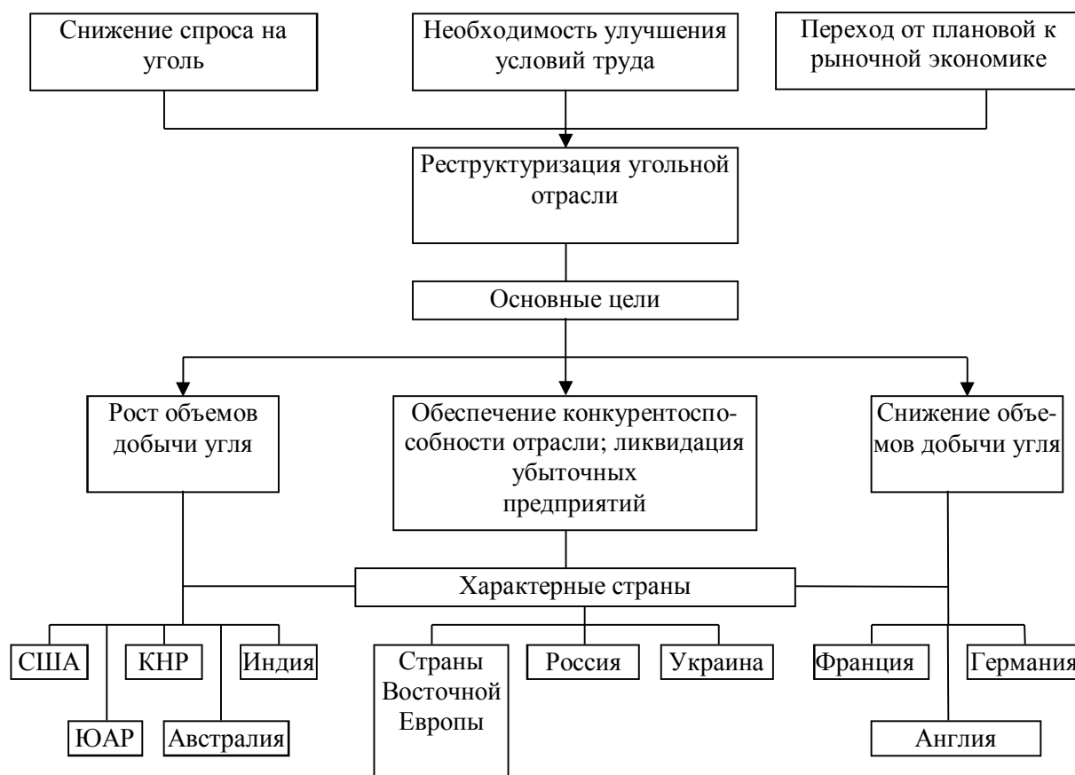
Рис.1. Схема побудительных мотивов и целей реструктуризации угольной отрасли в различных странах

Цели и методы проведения реструктуризации угольной отрасли в каждой отдельной угледобывающей стране вытекают из побудительных мотивов, представленных на рис. 1.