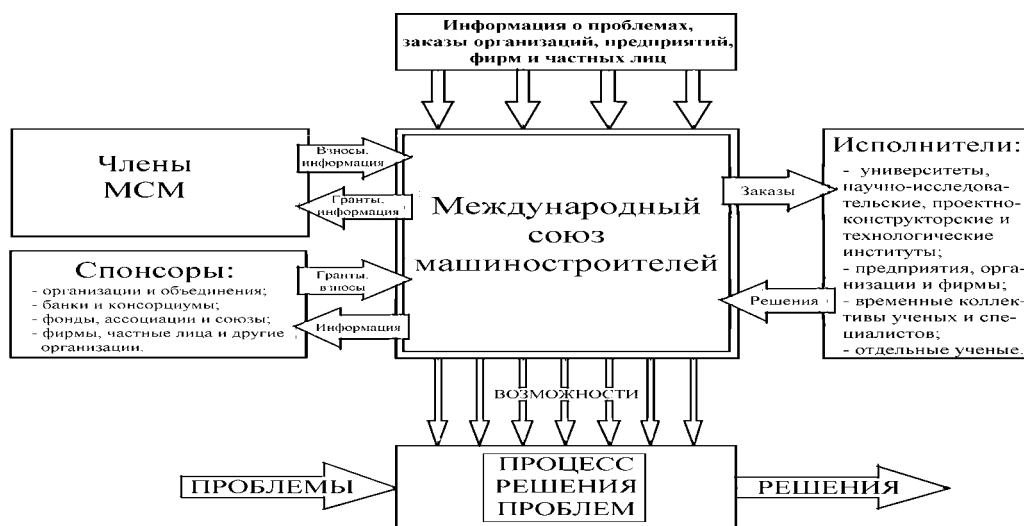
Рис. 2. Модель организации международной деятельности

На рис. 2 показана структурная модель организации международной деятельности МСМ. Деятельность МСМ это комплексная работа, направленная на содействие решения международных и других производственных проблем, возникающих в условиях видоизменяющейся