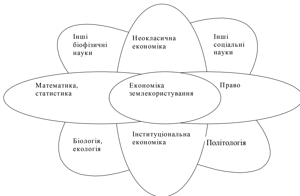
Рисунок 2. Інтелектуальна родина економіки землекористування

Стосовно економіки землекористування можна зробити висновок, що дана наука не є у чистому виді підвидом іншої науки, а самостійним науковим напрямком, який інтенсивно розвивається, інтегруючи теоретичні положення економіки природних ресурсів, інституціональної економіки, неокласичної економіки та багатьох інших наук, що стосуються землі і довкілля.