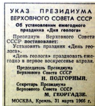
Сообщение об учреждении Дня геолога в газете «Известия»

Наибольшее значение из хранящегося в недрах Украины сырья имеют железные, марганцевые, урановые руды; уголь, газ, нефть и конденсат; титан, циркон; каолин и глины, соли, графит; нерудное сырье для металлургии; облицовочные и строительные камни; минеральные воды; благородные, редкие