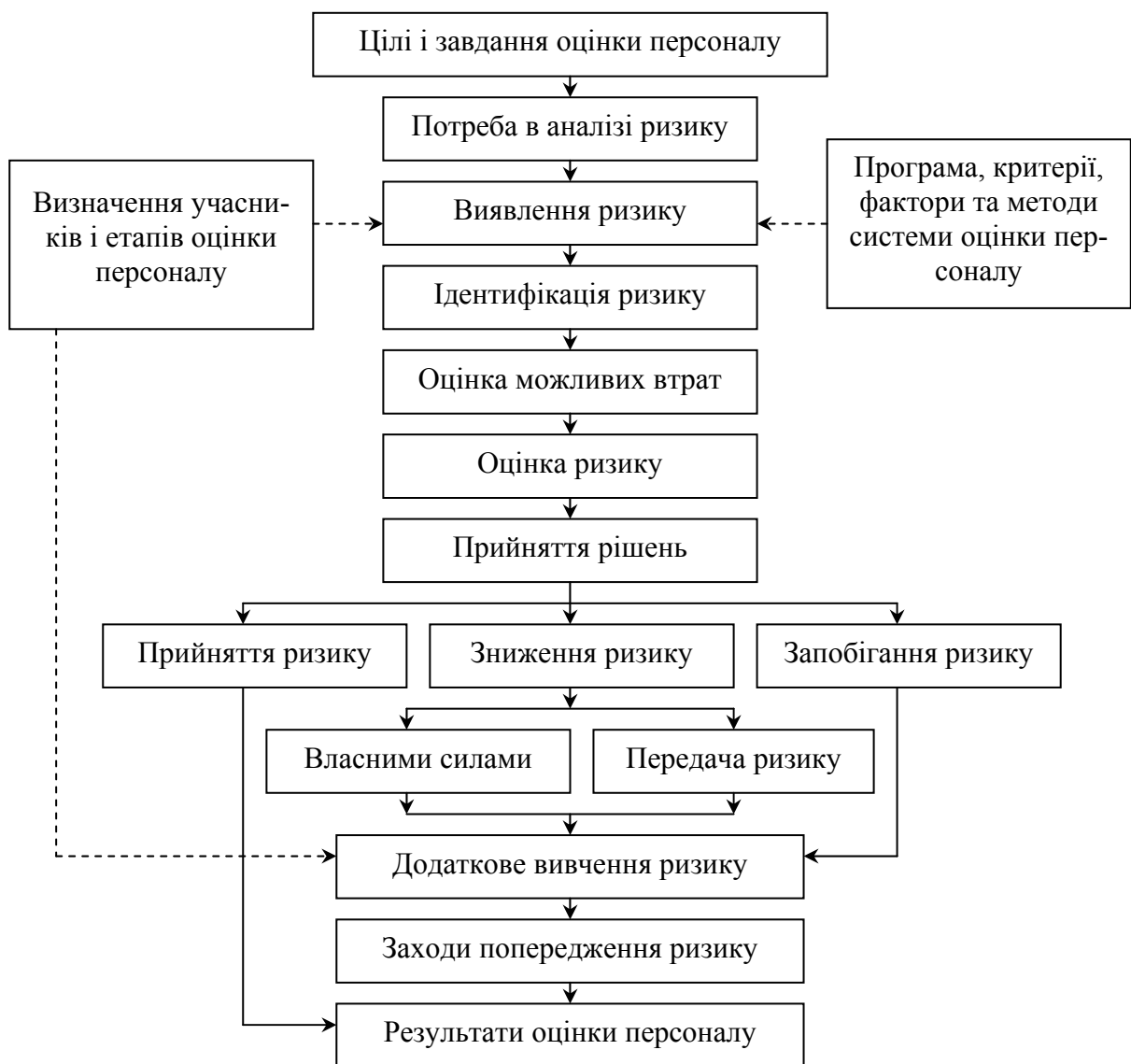
Рис. 2. Послідовність аналізу ризику при оцінці персоналу

Втрати, що можуть бути наслідком наявності ризику при оцінці персоналу, доцільно розділяти на матеріальні, трудові, фінансові, втрати часу, специфічні. Оцінку матеріальних втрат слід здійснювати в тих же одиницях, в яких вимірюється кількість конкретного виду матеріальних ресурсів. Узагальнення таких втрат є неможливим, тому доцільно обчислення втрат у вартісному виразі за формулою: