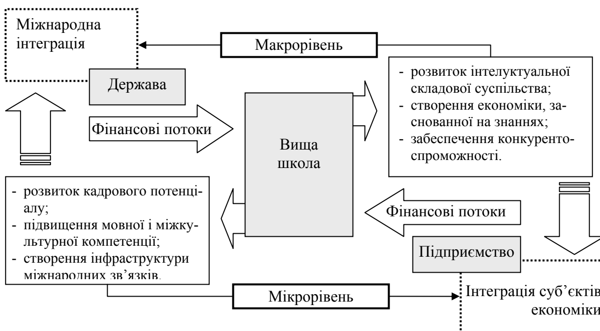
Рис. 2. Участь вищої школи в інтеграційних процесах на макро- і мікрорівнях

Діяльності вищої школи також сприяє інтеграції на макрорівні, сприяючи розвитку інтелектуальної складової суспільства, створенню економіки знань та забезпеченню конкурентоспроможності України на міжнародному рівні. Більш того, в описаній моделі важливо звернути увагу на зв'язок процесів інтеграції на макро- і мікрорівнях, оскільки вони взаємно впливають один на одного. Отже, інтеграція суб'єктів господарювання спонукає зближення державних політик та економік, а воно, в свою чергу, відкриває нові можливості для співпраці та виходу на нові ринки товарів та послуг.