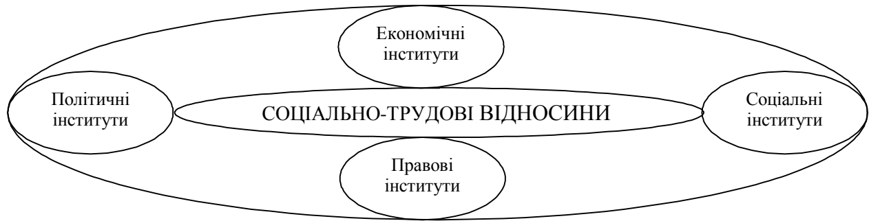
Рисунок 1. Система формальних інститутів соціально-трудових відносин

Систему формальних інститутів можна зобразити схемою, що представлена на рис.1.