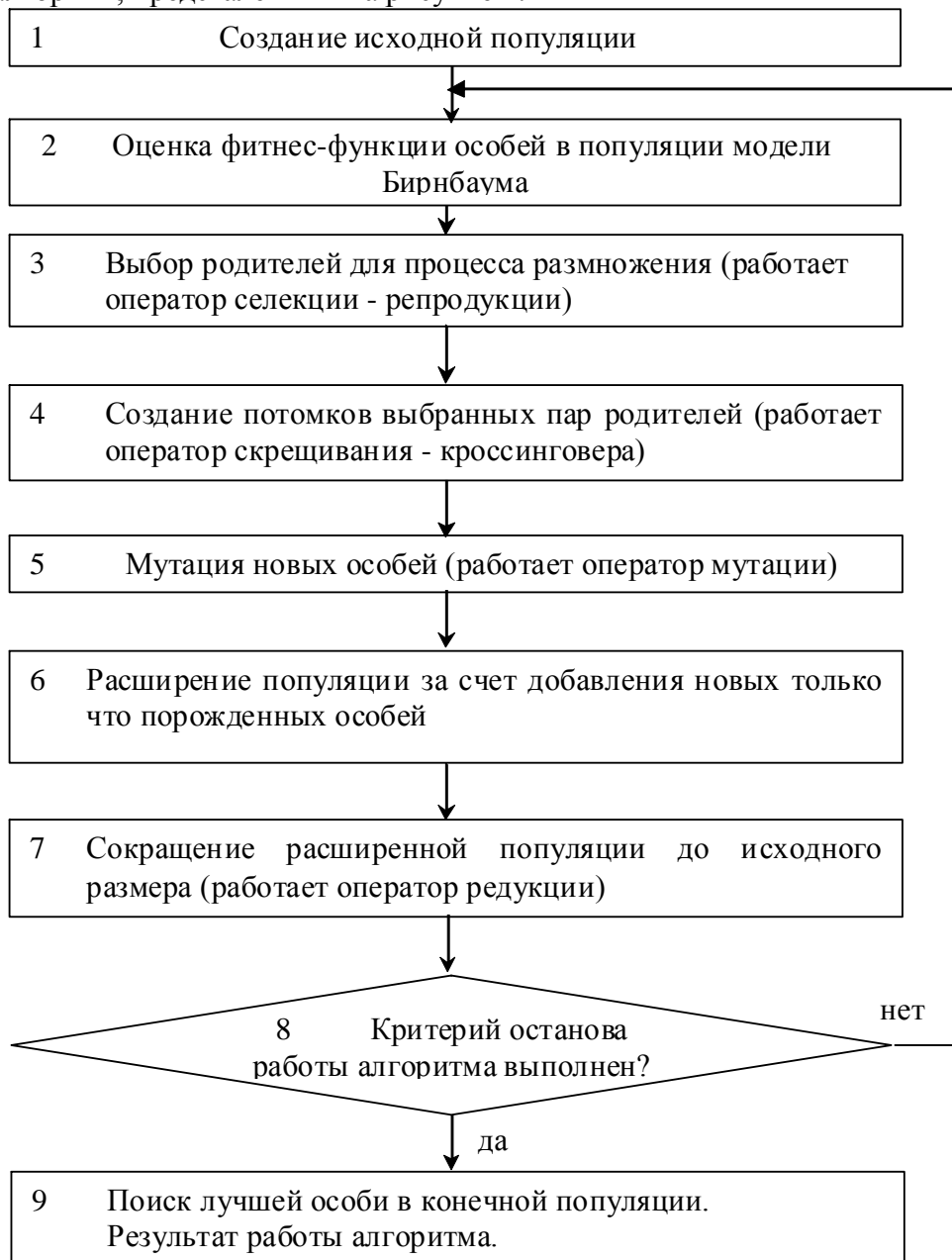
Рисунок 2 – Простой генетический алгоритм

Как уже упоминалось выше, система позволяет генерировать тестовые задания разной сложности. Для автоматического формирования тестовых заданий используется генетический алгоритм, представленный на рисунке 2.