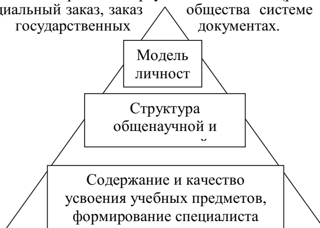
Рис. 2. Иерархия целей в педагогической системе