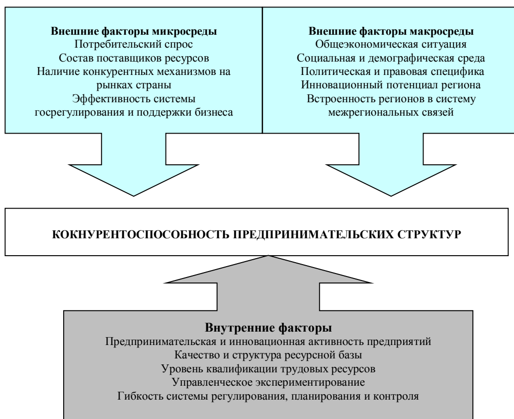
Рисунок 1. Система факторов, влияющих на формирование конкурентоспособности предпринимательских структур

жение к интересам и желаниям других участников рынка, так как при добровольном обмене в условиях конкуренции каждый может поддерживать и улучшать свое экономическое положение, если он предлагает товары и услуги, которые пользуются спросом. Эти условия должны стать постоянно воспроизводимыми, которые обеспечивают бесперебойное функционирование хозяйственной системы, в том числе системы цен, свободного доступа на рынок, частной собственности как предпосылки индивидуальной свободы, добровольности заключения договоров, отражающих права и обязанности сторон.