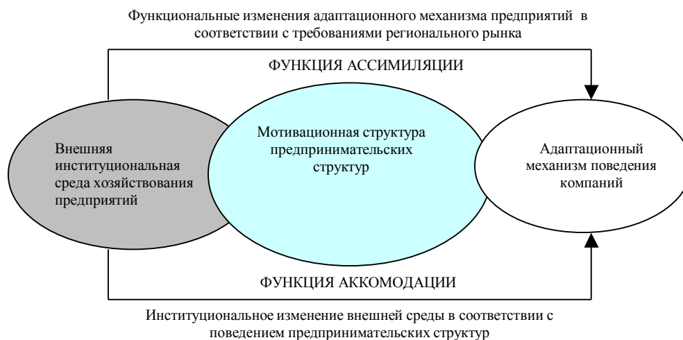
Рисунок 3. Модель институциональной адаптации предпринимательских структур к условиям конкурентно-предпринимательской среды региона

В целом, процесс институциональной адаптации предпринимательских структур в системе отношений субъектов конкурентно-предпринимательской среды региона предполагает, с одной стороны, взаимодействие с внешней средой регионального рынка ресурсов, а также товаров и услуг, в результате чего институциональная структура внешней среды воздействует на структуру мотивов владельцев и работников компаний и совместно выражается в адаптационном механизме; а с другой стороны, адаптивное поведение предприятий в отраслевой структуре вносит соответствующие изменения в институциональную практику «подстраивая» внешнюю среду под себя (рис. 3).