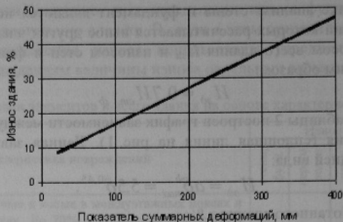
Рис. 2 Зависимость износа здания от показателя суммарных деформаций.

Аналитически эта зависимость может быть выражена следующей упрощенной формулой: