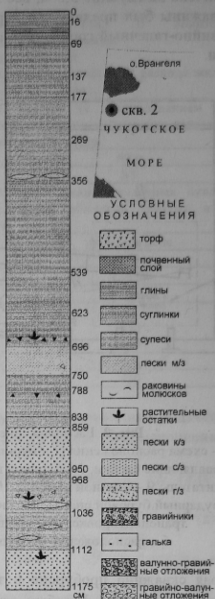
Рис. 4. Разрез по скважине №2 в Чукотском море