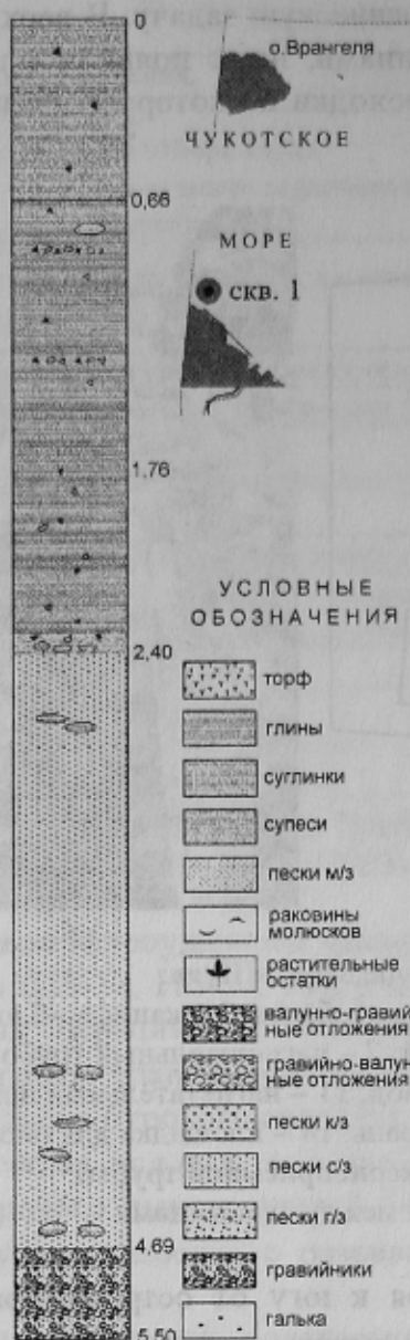
Рис. 3. Разрез по скважине №1 в Чукотском море