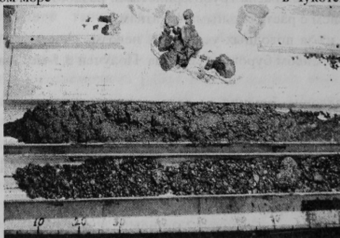
Рис. 5. Фрагмент керна по скважине №1 (интервал 3,7–5,5 м) в Чукотском море