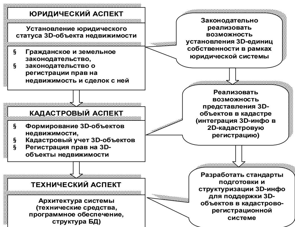
Рисунок 3 – Методологические основы построения 3D-кадастра

мо отметить, что юридический аспект является доминирующим, так как он создает фундамент для решения кадастровых и технических вопросов [6].