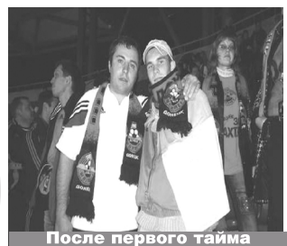
После первого тайма

Матч окончился со счётом 1:1. Нас это вполне удовлетворяло - «Шахтёр» вышел в кубок УЕФА, а «Олимпиакос» вылетел. Вот