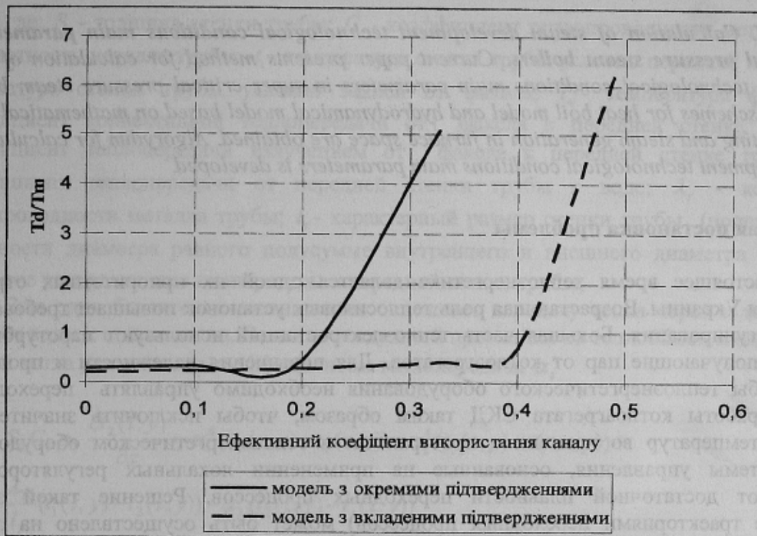
Рисунок 3 - Нормований час відповіді в мережі без встановлення з'єднання ( k=1 )

Другий випадок ( k=1 ) є, так би мовити, критичним, адже система, у якій довжина службових повідомлень перевищує довжину інформаційних, не має сенсу. В цьому випадку модель з окремими підтвердженнями значно програє моделі з вкладеними. Адже граничне значення \rho_M першої системи 0,33, тоді як другої – 0,5. Крім того, вже на рівні 0,3 модель з окремими підтвердженнями має приблизно в 3 рази більший час відгуку у порівнянні з моделлю, що орієнтована на передачу підтверджень в пакетах зворотного напрямку (1,2 в порівнянні з 0,4).