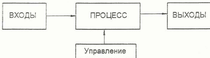
Рис. 1 – Схема процесса «Черный ящик»