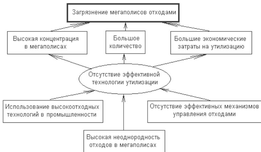
Рисунок 1. Причинно-следственные связи вопросов переработки отходов в мегаполисах

Основным агрегатом для реализации процесса является термолizный энергоблок, который объединяет в единой конструкции несколько термолizных камер с топкой и котлом-утилизатором (рис.2).