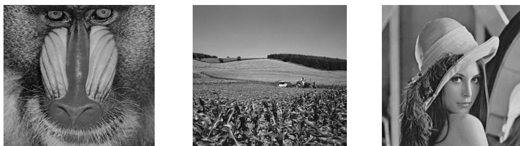
Рисунок 1 – изображения «baboon», «cornfield» и «lena» (уменьшенные)

Исходные (несжатые) изображения в BMP и TIF формате сжимались по алгоритму JPEG с сохранением в формате JPG. Следует учесть, что изменение параметров отнюдь не линейно, и среднее значение далеко не всегда даст оптимальный результат.